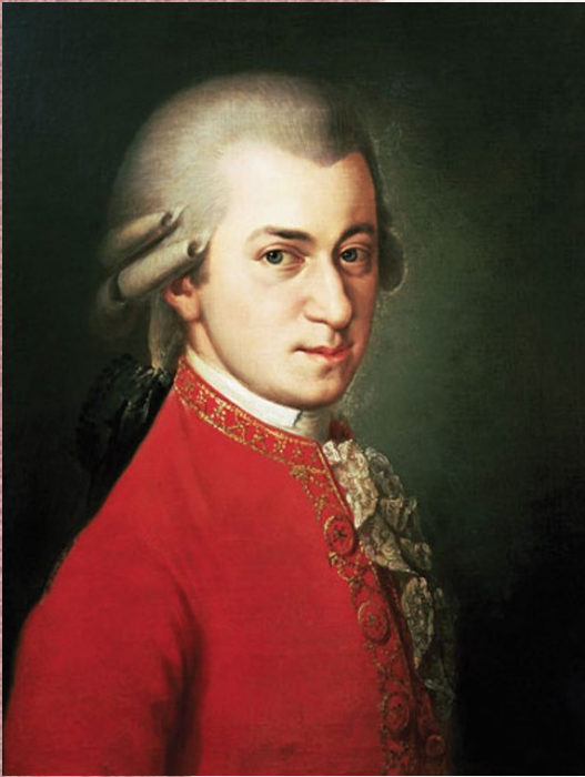
W. A. MOZART